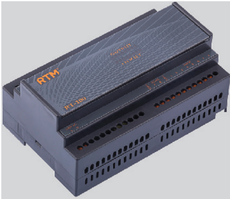
RT-100 Röle Ünitesi Çoklu Giriş ve Çıkış ünitesi ihtiyacınıza uygun olarak tasarlanmıştır. Ek modüldür.