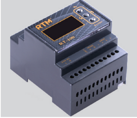
RT-100 4 Kanal Röle Ünitesi İnternet üzerinden 4 adet Giriş (Input) ve 4 adet Röle Çıkışı (Output) kontrol edebilirsiniz.