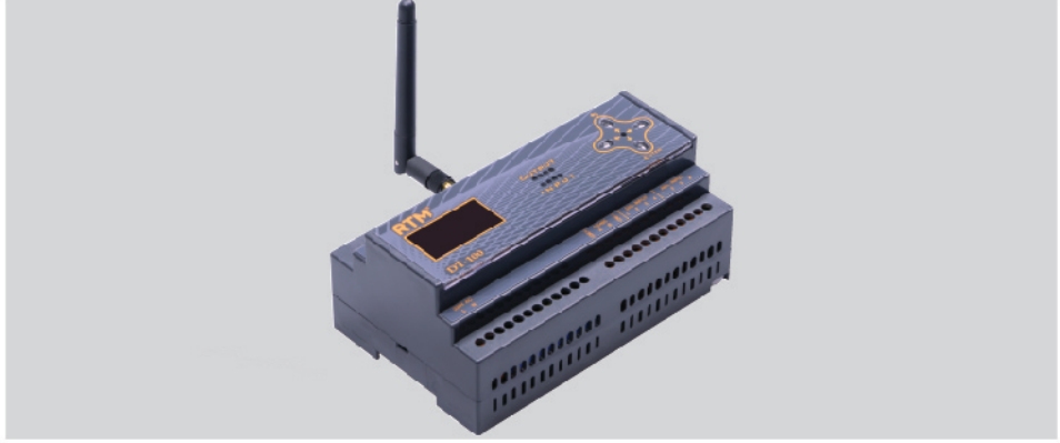
DT-100 Kontrolcü İnternet üzerinden 4 kanal 0-10 V çıkışını kontrol edebilirsiniz.