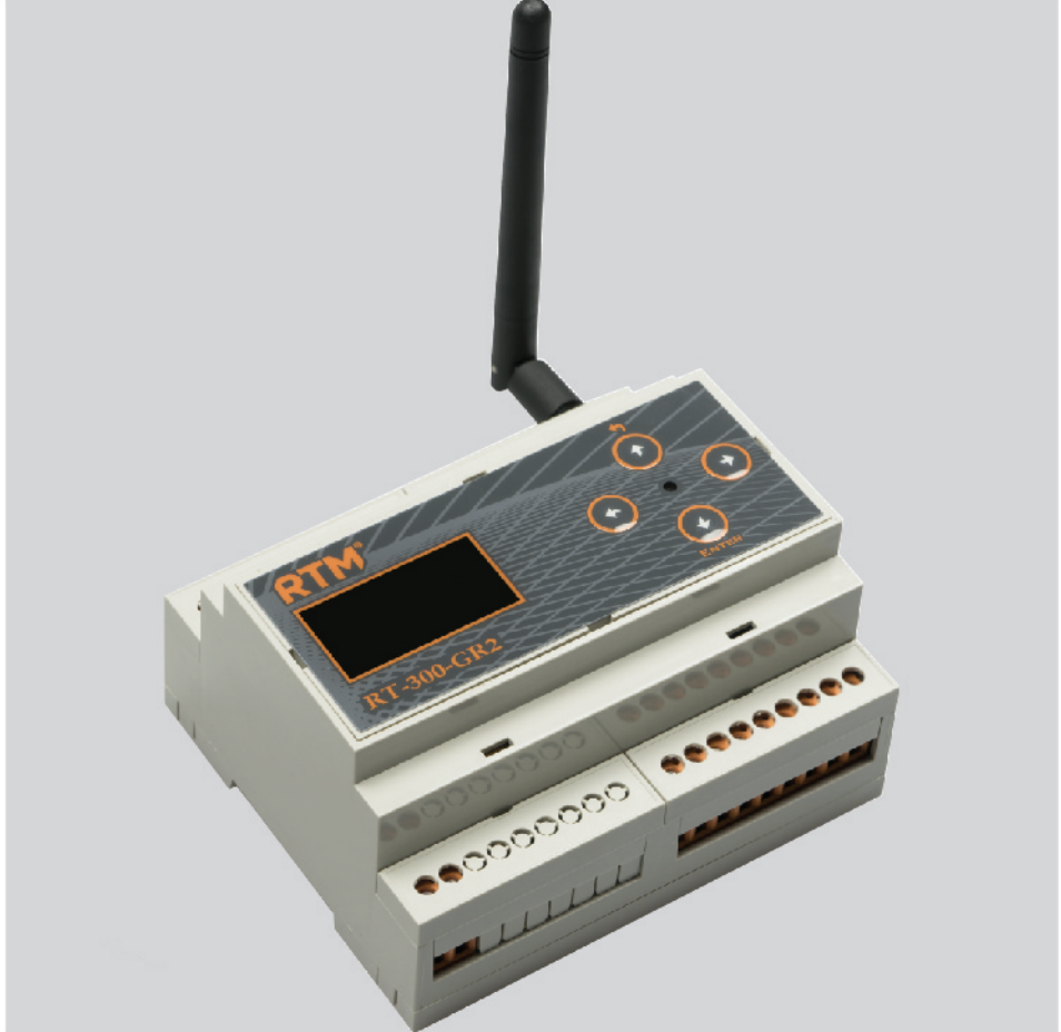
RT-300 GR2 Haberleşmeli GSM Ağ Geçidi GSM üzerinden 6 adet Giriş ve Röle Çıkışını kontrol edebilirsiniz.